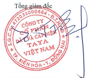
WANG TING SHU