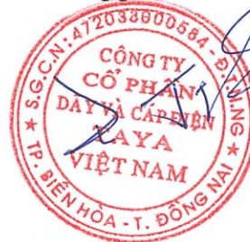
WANG TING SHU