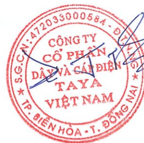
WANG TING SHU